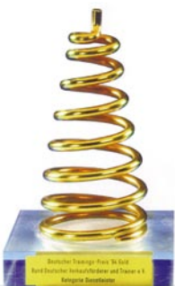
1994 Deutscher Trainingspreis in Gold für IntervallTraining Verkauf