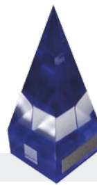
2006 Internationaler Deutscher Trainingspreis in Silber für Großhandelskonzept