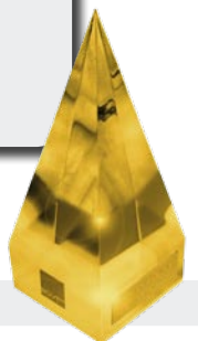
2008 Internationaler Deutscher Trainingspreis in Gold für Kompetenz- management und Bildungscontrolling