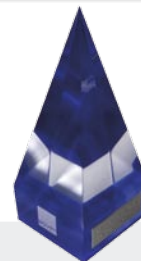
2007 Internationaler Deutscher Trainingspreis in Silber für Coaching der Unternehmensnachfolge