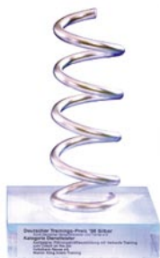
1998 Deutscher Trainingspreis in Silber für Führungskraft als Coach